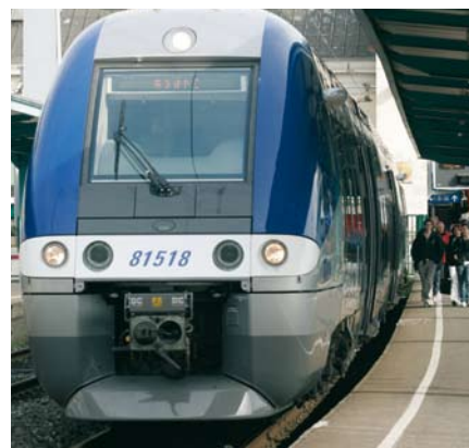
Les lycées et les transports collectifs régionaux font partie des grands domaines de compétences de la Région.