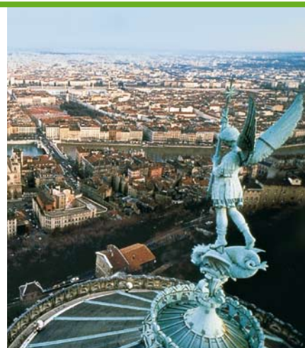
Vue de Lyon.

Ce rayonnement se double d'actions spécifiques de solidarité en Afrique (Mali, Sénégal, Burkina Faso, Madagascar, Afrique du Sud...) comme en Asie du Sud Est (Vietnam, Laos...).